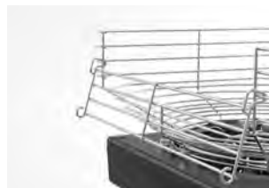
Cesta con puerta abatible

Cesta con puerta abatible que facilita la carga de frutas. Su característica doble posición permite colocar la puerta tanto en la parte frontal como en la parte trasera en función de las necesidades concretas de cada establecimiento.