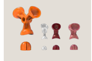
Kits de exprimido

Accesorios: S: Gris; L: Granate; XL: Rosa.