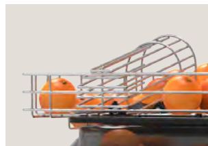
Sensor contact de serie

La máquina entra en funcionamiento automáticamente cuando el sensor Contact, incorporado de serie, detecta naranjas en la rampa. Se detendrá también de forma automática cuando no haya naranjas en la rampa, quedando el exprimidor en modo stand by.