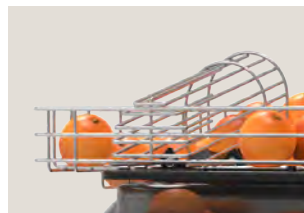
Sensor contact de serie

La máquina entra en funcionamiento automáticamente cuando el sensor Contact, incorporado de serie, detecta naranjas en la rampa. Se detendrá también de forma automática cuando no haya naranjas en la rampa, quedando el exprimidor en modo stand by.