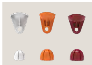
Kits de exprimido

Pequeño (S): Gris; Mediano (M): Naranja; Grande (L): Granate.