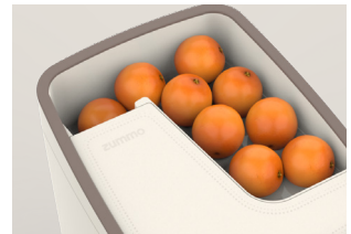
Dispensador de frutas

Hasta 1,5 kg de fruta en el mínimo espacio. Su diseño en pendiente facilita la carga y hace visible la fruta, generando reclamo en tu local.