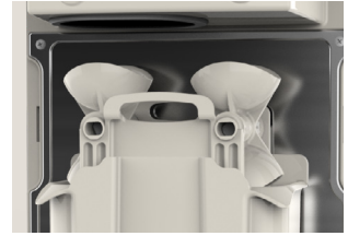
EQS y EVS Advanced

Monta y desmonta fácilmente el kit de exprimido vertical EVS en un solo movimiento, gracias a EQS (Exchange Quick System). Con este intuitivo sistema, el kit de exprimido se agrupa en un solo bloque minimizando el número de piezas. Así ahorras tiempo y maximizas tu experiencia de usuario.