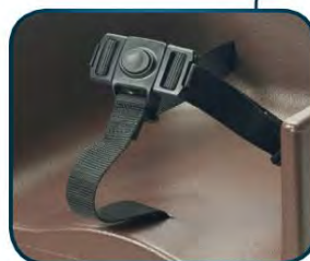
Arnés de sujeción central de 3 puntos