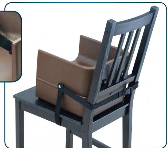
Asegure al respaldo y al asiento de la silla