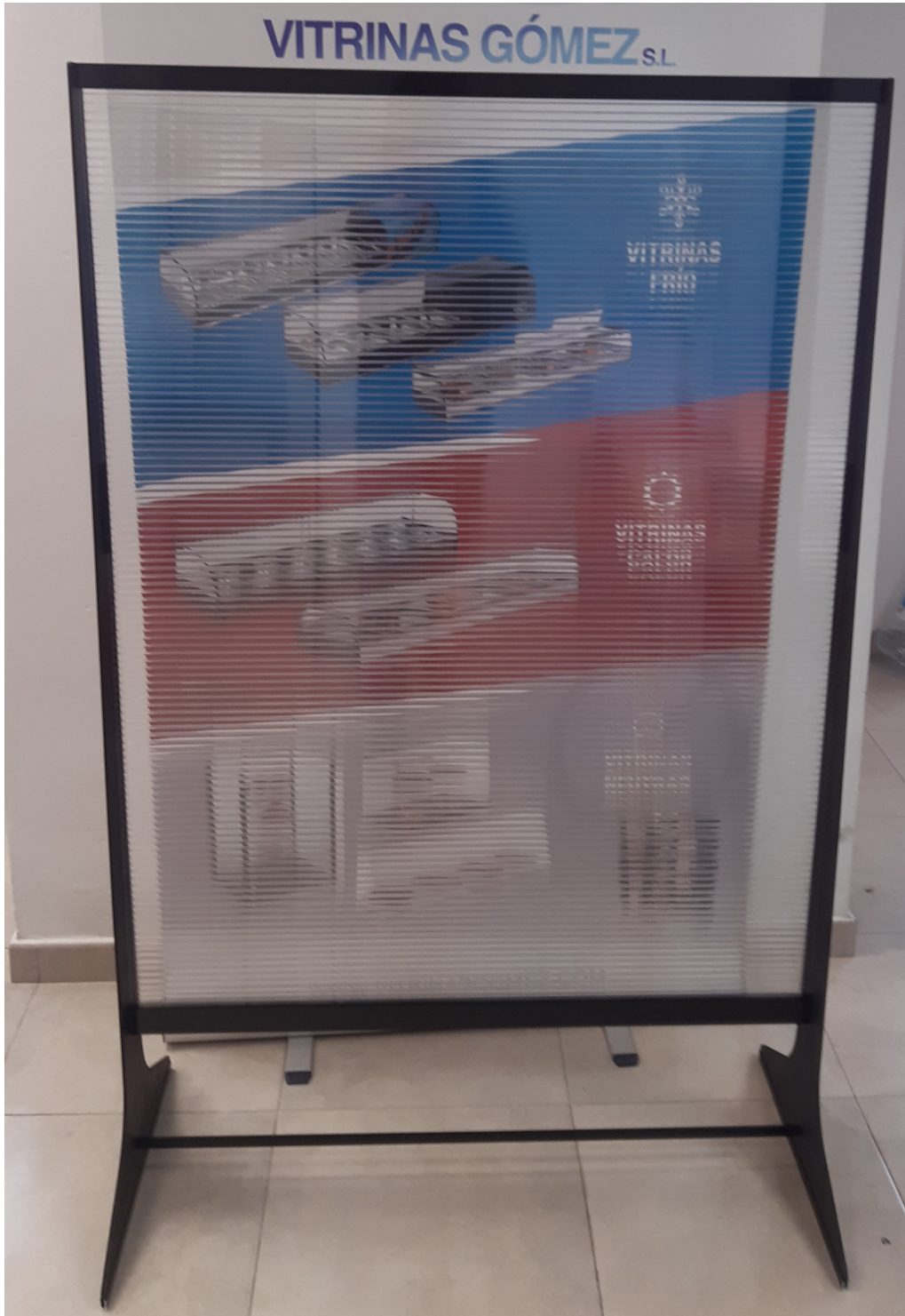
MODELO BPC 100