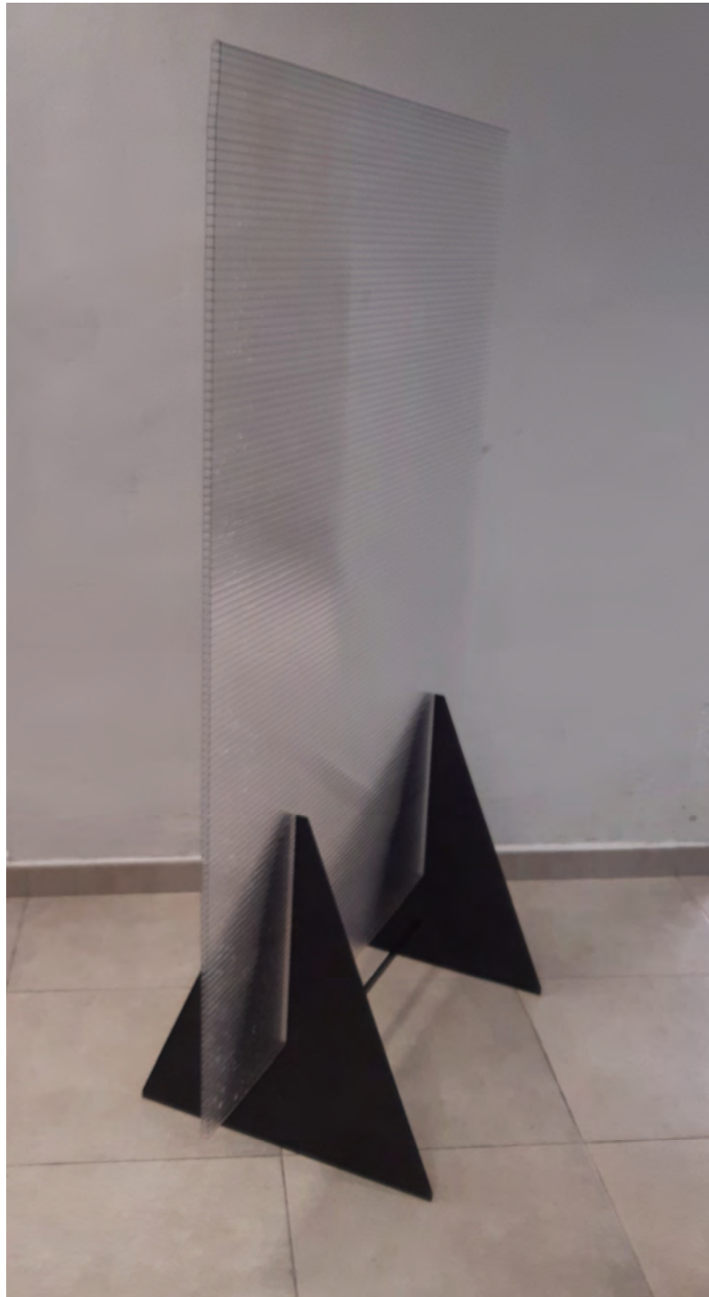
MODELO PTR 10