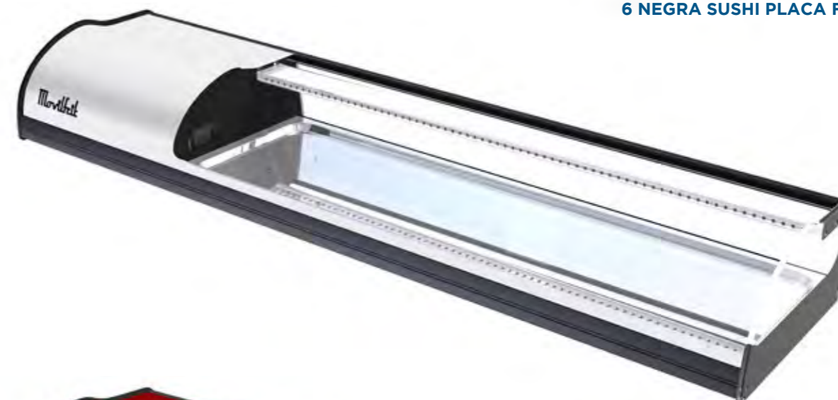
6 BLANCA SUSHI PLACA FRÍA