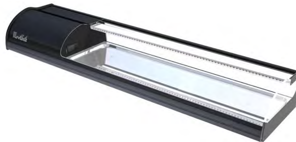
6 NEGRA SUSHI PLACA FRÍA