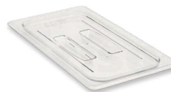
TAPA CUBETA POLICARBONATO INCLUIDA