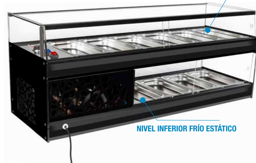
NIVEL SUPERIOR CALOR SECO