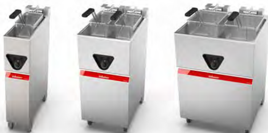
C200 / C200T