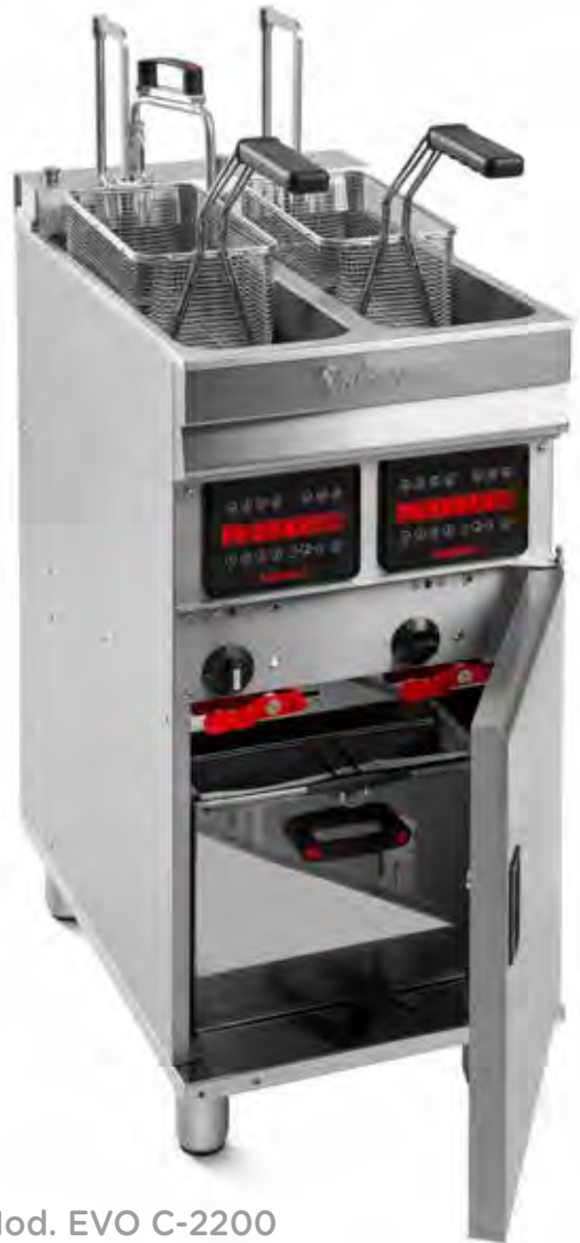
Mod. EVO C-2200 Con elevador y bomba de filtraje

Temperatura controlada electrónicamente.