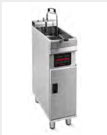
Mod. EVO C 250 Con elevador