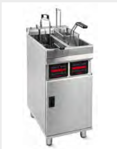
Mod. EVO C 2200 Con elevador y bomba de filtraje