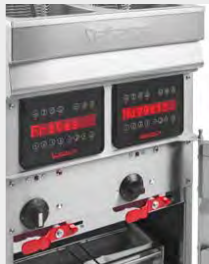
Mod. EVO C 2200 Detalle Panel de Mandos