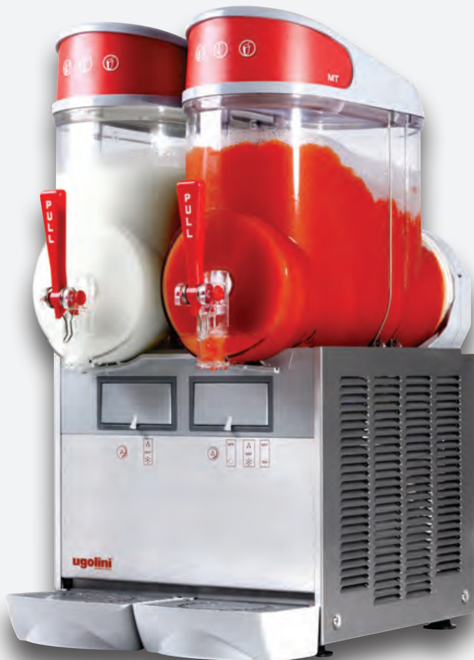
Mod. MT 2B