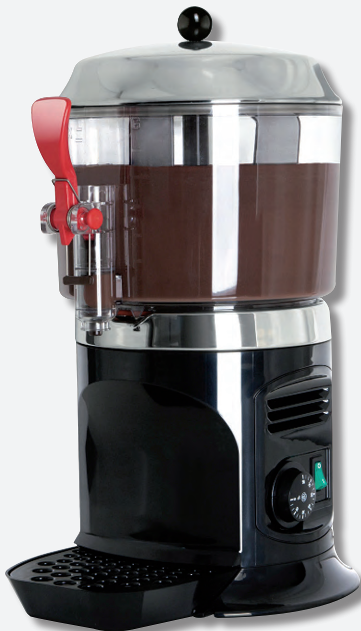
Mod. DELICE 5