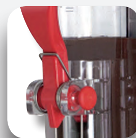
Maneta salida producto.