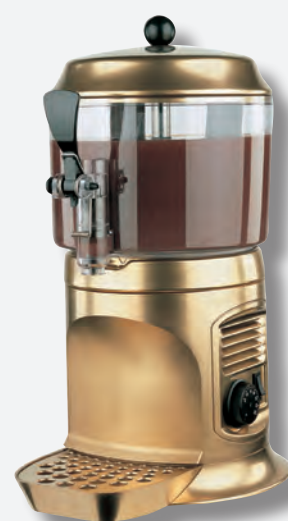
Mod. DELICE 5 GOLD