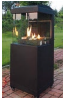
OSLO 3 caras