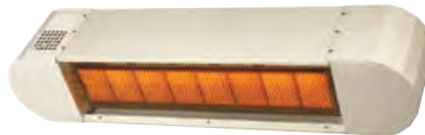
Modelo DS carcasa redonda