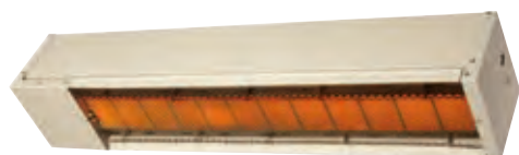
Modelo DS carcasa cuadrada

El funcionamiento muy silencioso, es una de las características de las pantallas SIABS y el modelo DS es ideal para la calefacción de las áreas de "fumar" externas y de las terrazas.