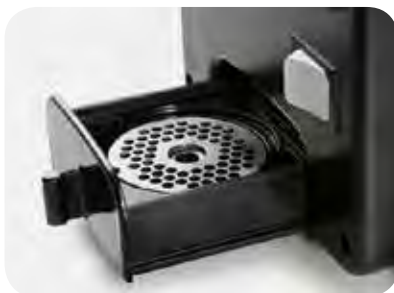
Cajón guarda placas en dotación.