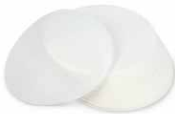
Papel celofán Ø 100mm / 500 unidades