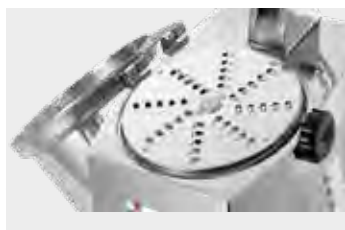
Tapa con apertura lateral.