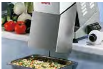
Tolva larga de descarga continua, con micro de seguridad opcional