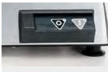
Botonera electrónica IP54.