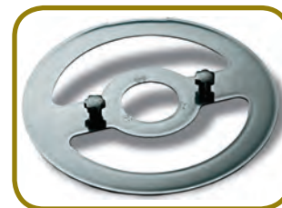
EXTRACTOR DE CUCHILLA DE SERIE