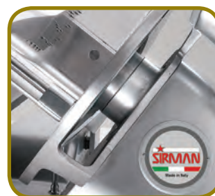
AMPLIO ESPACIO ENTRE MOTOR Y CUCHILLA

PALLADIO 350: A 465 - B 340 - C 660 - D 575 - E 455 - F 710 - G 530 - L 580 - X 270 - Y 225 - H 275 - W 250