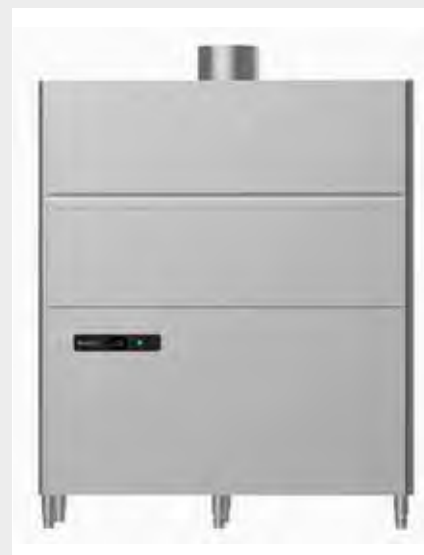
Mod. LP-109 EVO