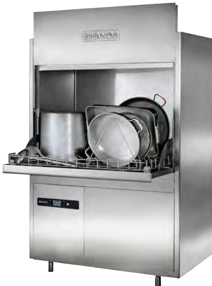
Mod. LP-109 EVO