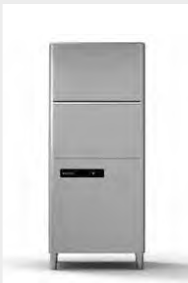
Mod. LP-57 EVO