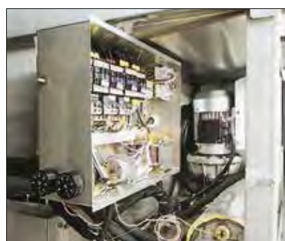
Cuadro eléctrico LP-67