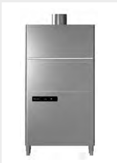
Mod. LP-67 EVO