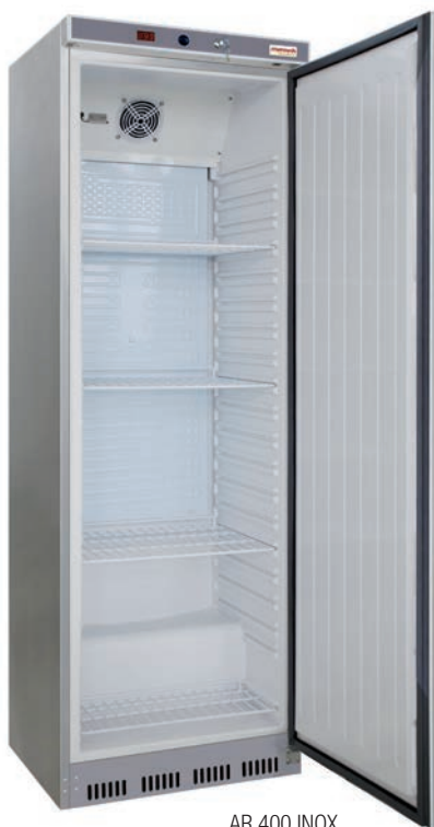
AR 400 INOX