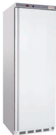
AR 400 BLANCO ARC 400 BLANCO