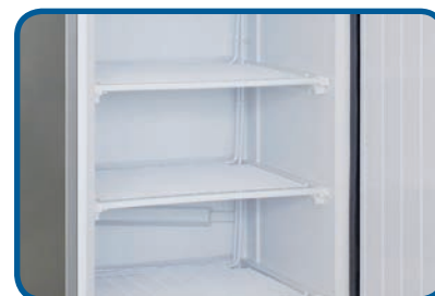
Detalle int. ARC 400 INOX-BLANCO Distancia entre estantes: 205 mm.