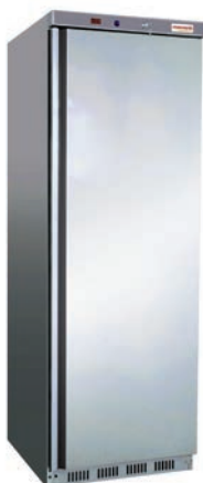
AR 400 INOX ARC 400 INOX