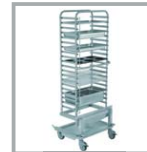
BANDEJERO 20 GN1/1