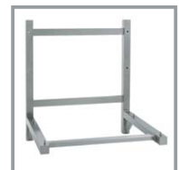
SOPORTE PARED SC/623