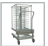
CARRO BANQUETES 60 PL