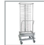
CARRO BANQUETES 48 PL