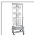
CARRO BANQUETES 48 PL