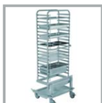
BANDEJERO 20 GN1/1