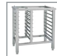
SOPORTE SC 8GN2/3