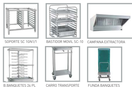
SOPORTE SC 16GN1/1 BASTIDOR MOVIL SC-10 CAMPANA EXTRACTORA B.BANQUETES 24 PL CARRO TRANSPORTE FUNDA BANQUETES