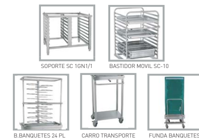
SOPORTE SC 16GN1/1 BASTIDOR MOVIL SC-10 B.BANQUETES 24 PL CARRO TRANSPORTE FUNDA BANQUETES