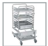
BANDEJERO 24 GN1/1