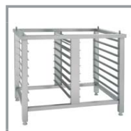
SOPORTE SC 1GN1/1