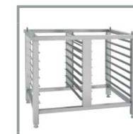
SOPORTE SC 1GN1/1