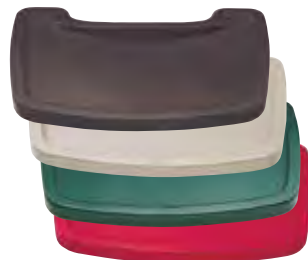
FG781588 Bandeja para la silla Sturdy Chair™ disponible en platino, verde oscuro, rojo y negro.