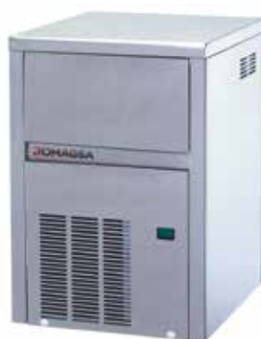
Mod. CB 246* * Modelos CB 246 y CB 249 también cubitos de 42 grs.