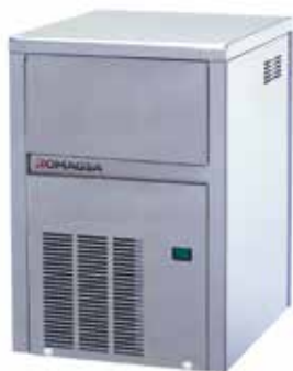
Mod. CB 184