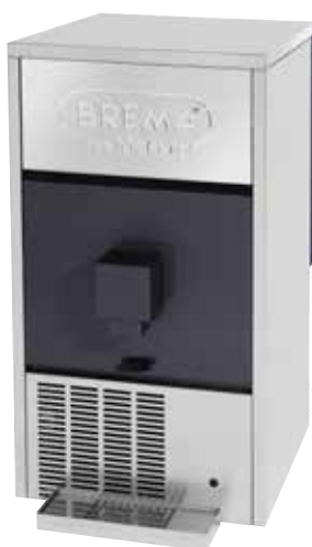
Mod. DSS 42 *Con dispensador de cubitos