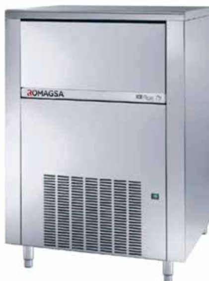
Mod. CB 1565 cubitos de 63 grs. (opcional)