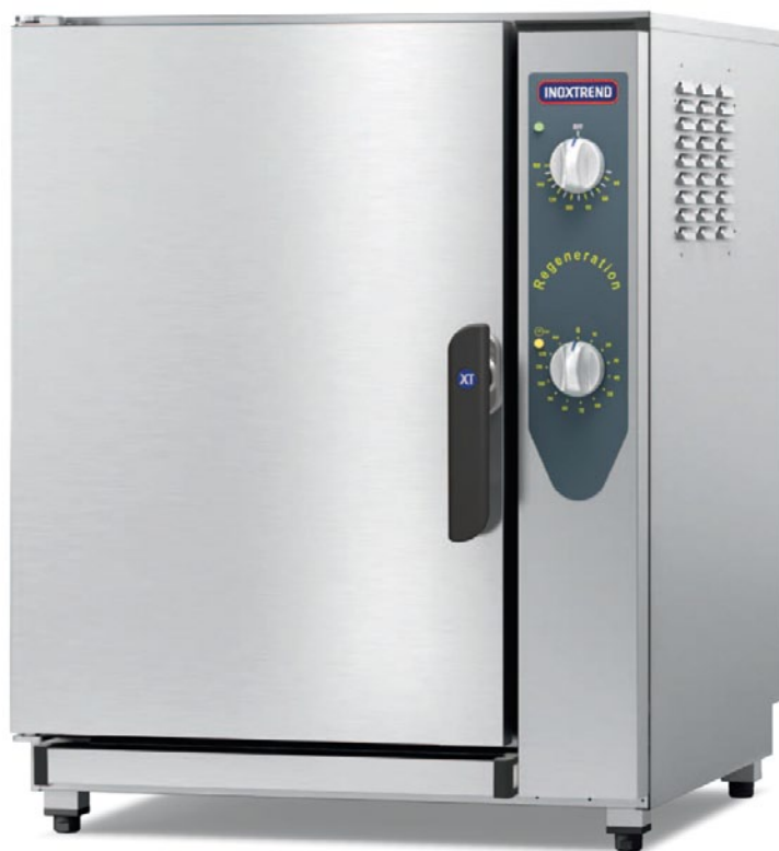
MOD. RRCA-110 E