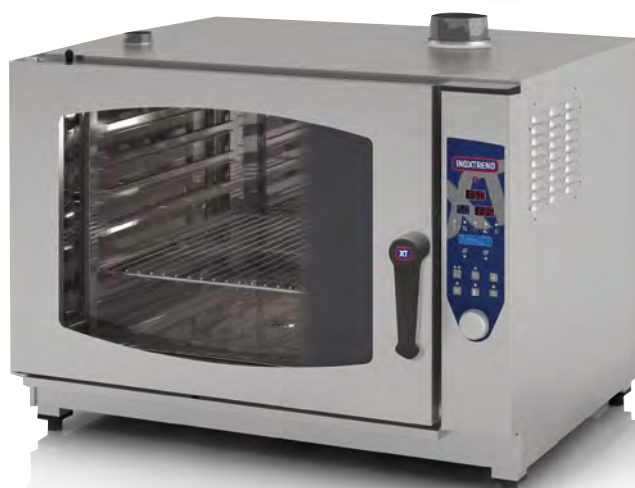
Mod. CDP 207 G