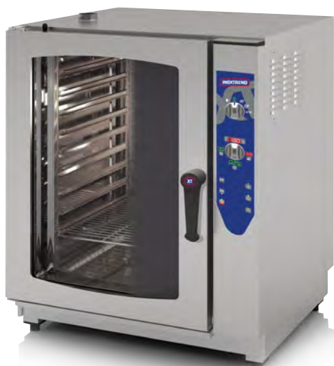
MOD. CDF 111 E