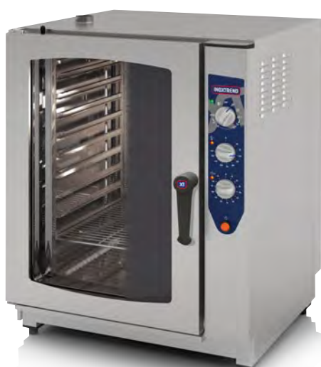
Mod. CDA 111 E