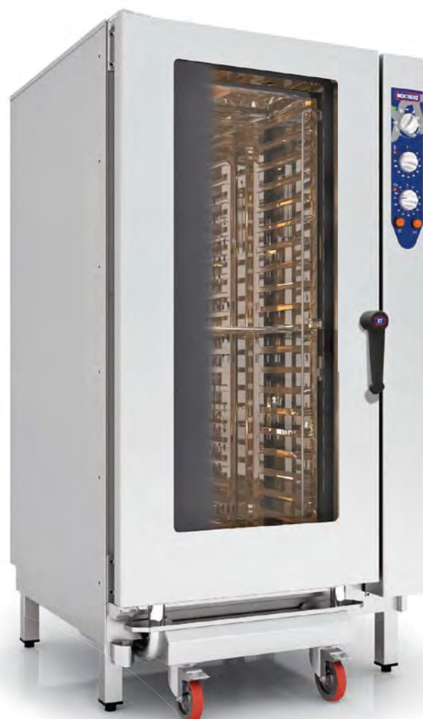
MOD. CDA 120 G