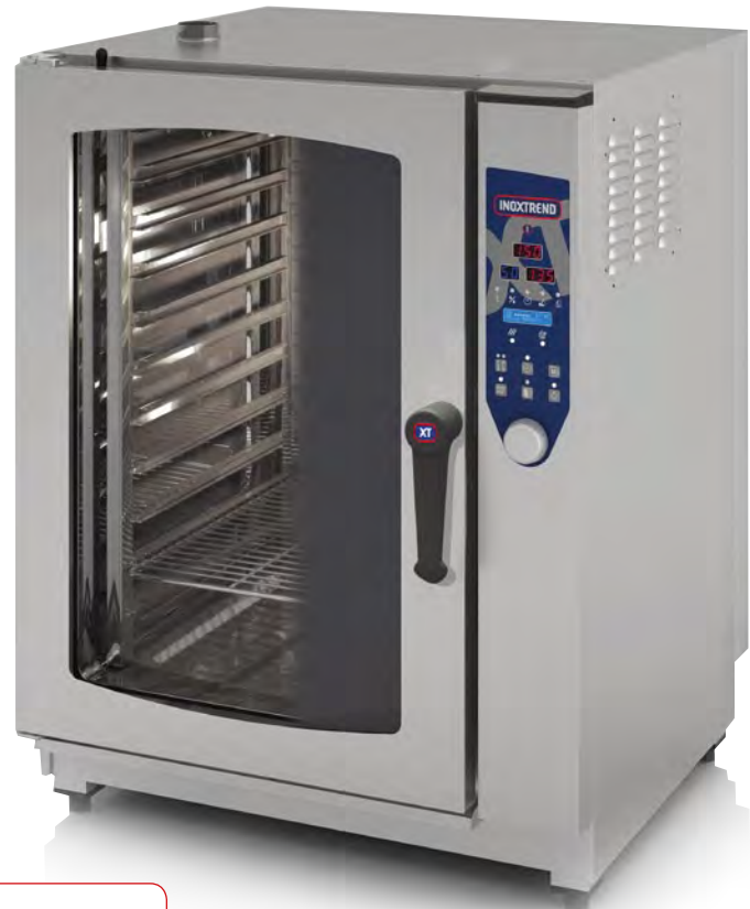
MOD. CDP-111 E