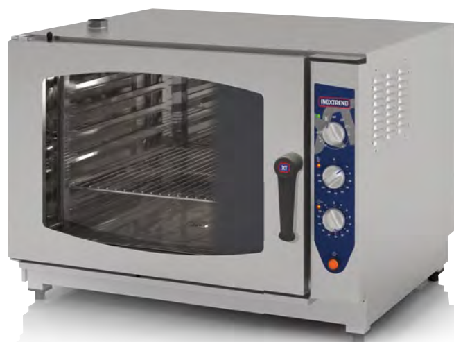
Mod. CUA-207 E