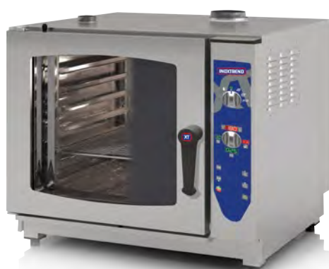
MOD. CDF-107 G