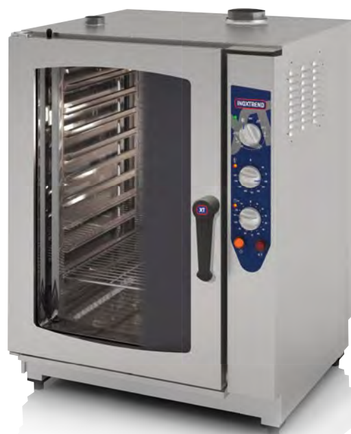
Mod. CUA 111 G