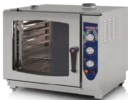
Mod. CDA-107 G