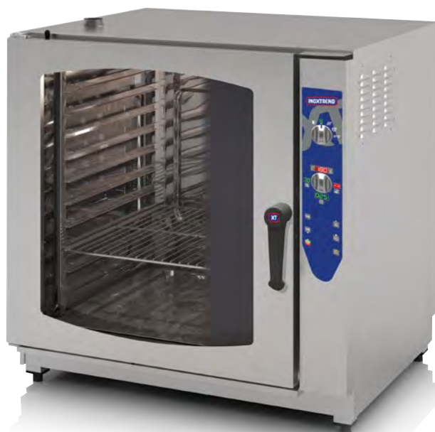
MOD. CDF 211 E