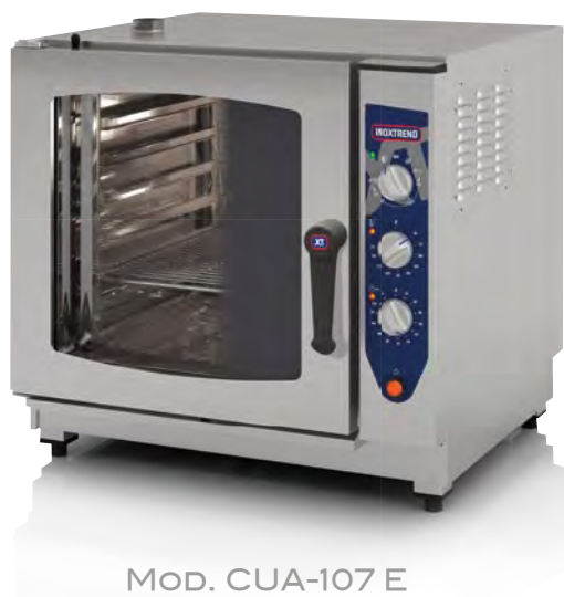
Mod. CUA-107 E