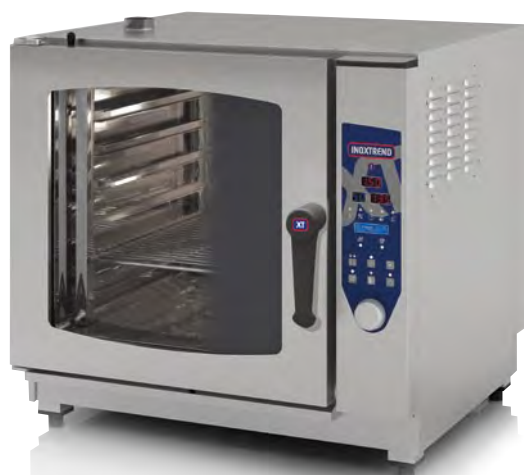
Mod. CDP 107 E