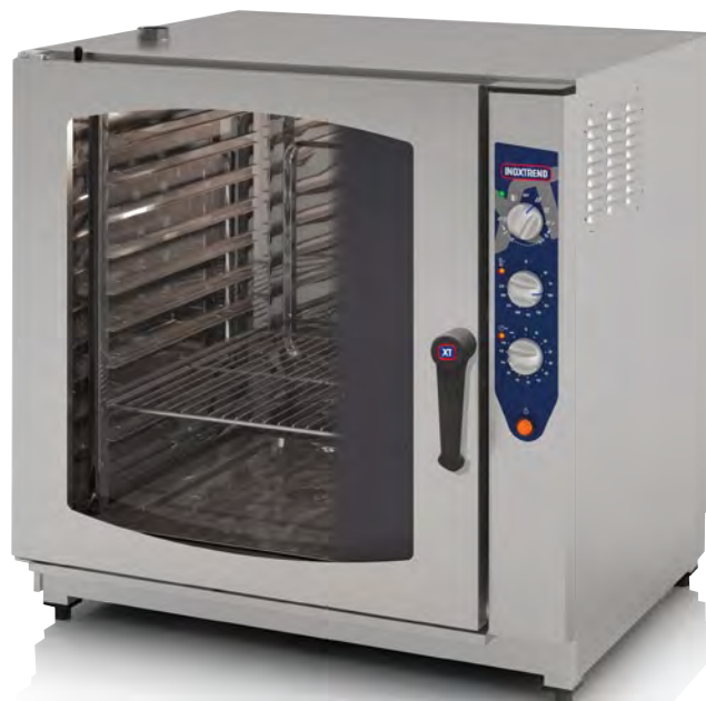
Mod. CDA 211 E