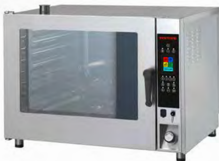
Mod. CDT 207 E