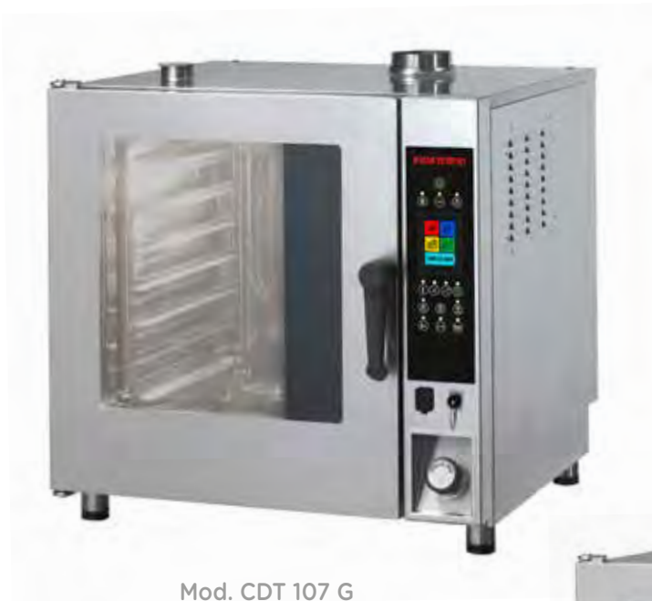
Mod. CDT 107 G