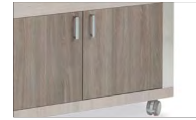
4 VANO INFERIORE NEUTRO CON ANTINE LOWER COMPARTMENT WITH DOORS