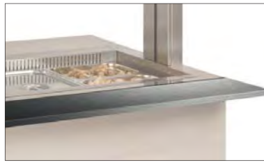
8 SCORRIVASSOIO RIBALTABILE IN ACCIAIO INOX STAINLESS STEEL FOLDABLE TRAY SLIDE