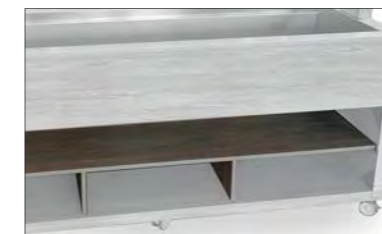
14 PIANO INTERMEDIO IN LEGNO NEL COMPARTIMENTO INFERIORE MIDDLE WOOD SHELF IN LOWER COMPARTMENT

L'optional è disponibile anche combinato con il vano inferiore neutro con antine (Opt.4). The Optionals is also available combined with the lower neutral compartment with doors (O