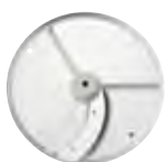
ESENCIAL Series 1-4