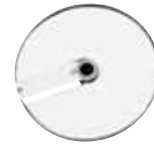
EXPERT Series 5-7