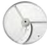
ESENCIAL Series 1-4