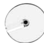
EXPERT Series 5-7

CL 50/CL 50 Ultra CL 52 /CL 55 CL 60/CL 60 V.V.