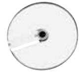
EXPERT Series 5-7

CL 50/CL 50 Ultra CL 52 /CL 55 CL 60/CL 60 V.V.