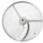
ESENCIAL Series 1-4