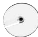
EXPERT Series 5-7