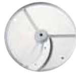
ESENCIAL Series 1-4