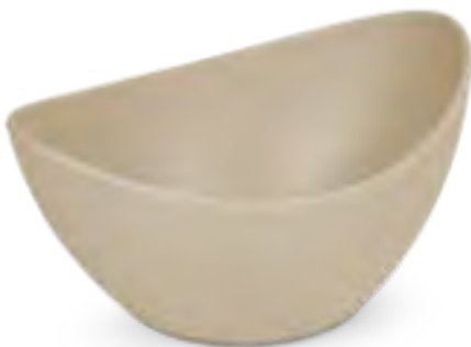
P22408 Oval bowl Bol ovalado Bol ovale