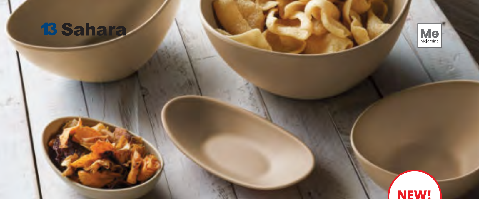
P22404 Oval plate Plato ovalado Assiette ovale