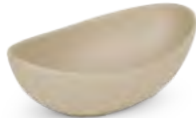
P22405 Oval bowl Bol ovalado Bol ovale