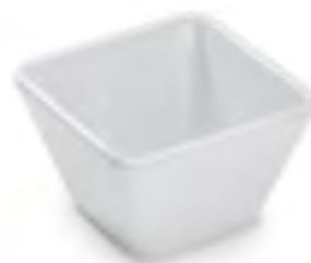
P222 Deep squared bowl Bol cuadrado hondo Bol carré