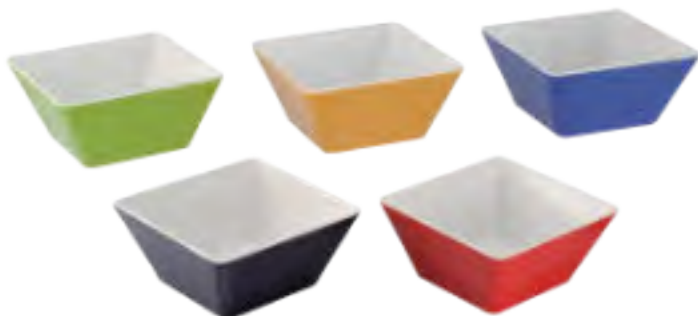
P2220 Two tones deep squared bowl Bol cuadrado hondo dos colores Bol carré deux couleurs