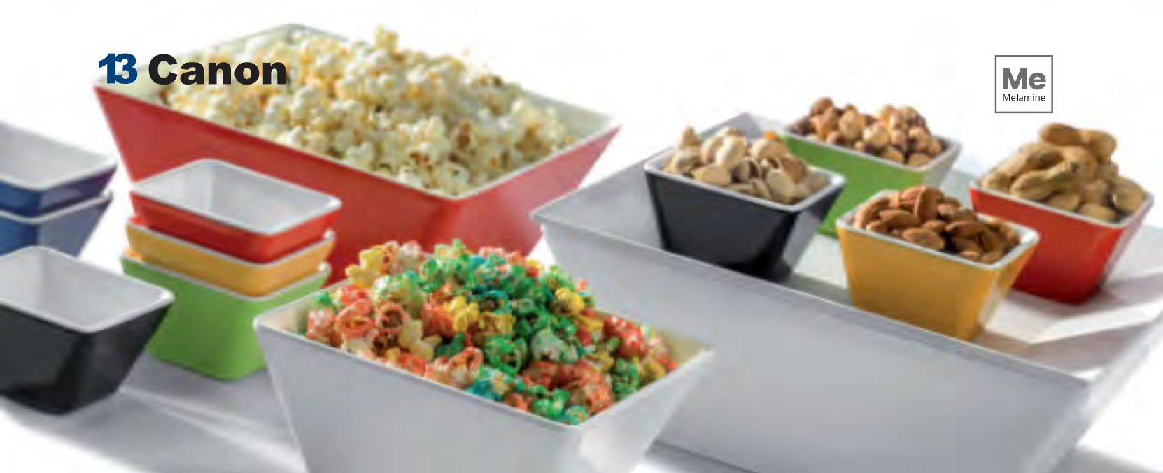
P22002 Squared display plate Bandeja exhibición cuadrada Plateau carré présentation