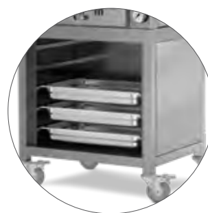
OVEN 50 & 90 5 1/1 GN capacity Capacidad para 5 cubetas GN 1/1 Capacité pour 5 bacs GN 1/1

GN not included GN no incluidas Bacs GN non inclus