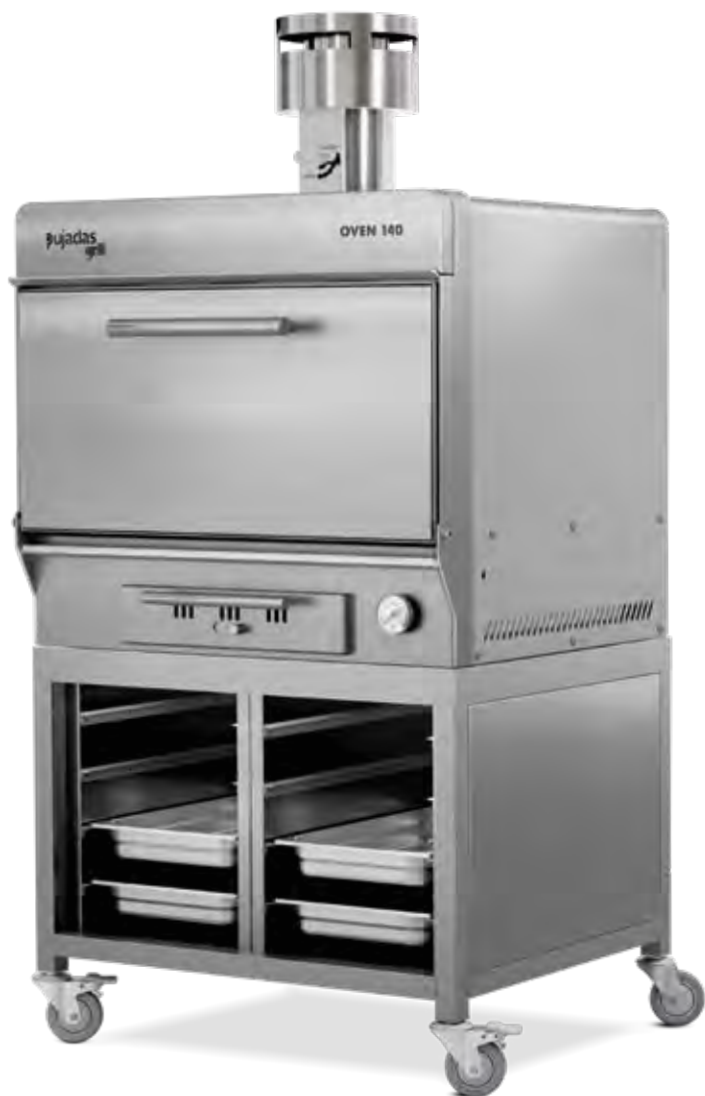
OVEN 140 8 1/1 GN pan capacity Capacidad para 8 cubetas GN 1/1 Capacité pour 8 bacs GN 1/1