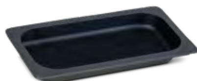
P851325 GN 1/3 special grill tray Bandeja GN 1/3 especial grill Plateau GN 1/3 spécial grill