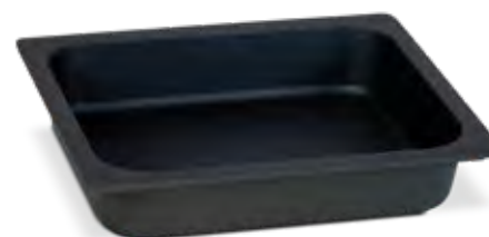
P851265 GN 1/2 special grill tray Bandeja GN 1/2 especial grill Plateau GN 1/2 spécial grill