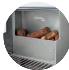
Fire basket to burn wood Leñero para quemar madera Brûleur à bois

Each open grill lite comes with / cada brasa abierta lite viene con / chaque grill ouvert lite est livré avec