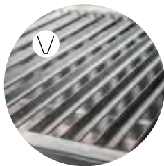
V shape grill Parilla en V Grille en V