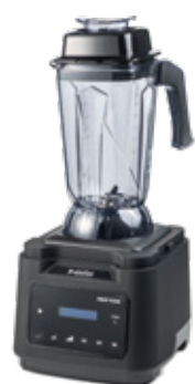
JAR PRO D