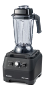
JAR PRO M