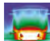
Innox - st/steel Rostfreier stahl