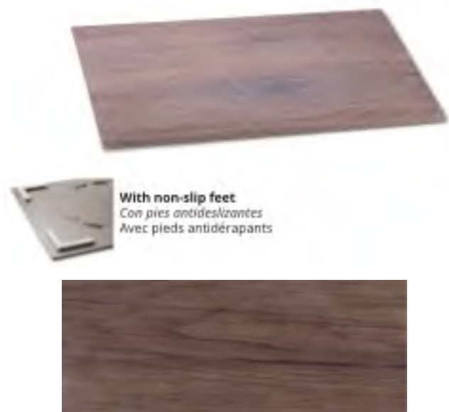
P2260 Oak display plate Soporte presentación roble Présentoir chêne

With non-slip feet Con pies antideslizantes Avec pieds antidérapants