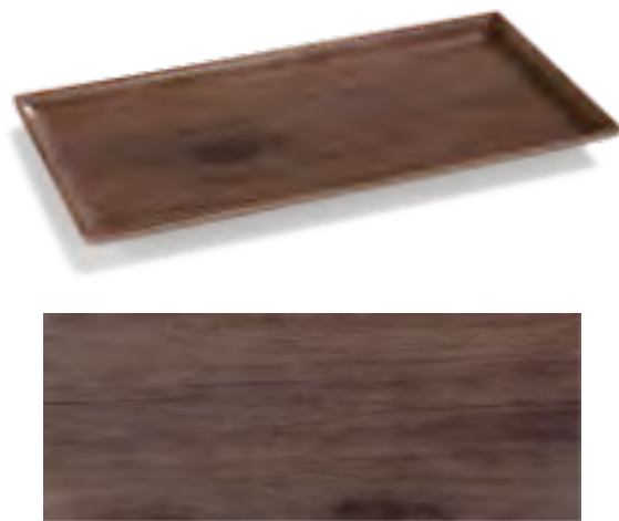
P2262 Oak serving tray Bandeja presentación roble Plateau présentation bois