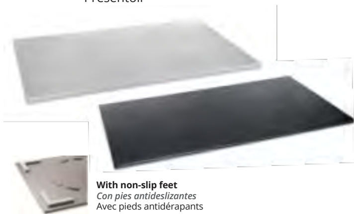
P2261 Display plate Soporte presentación Présentoir

With non-slip feet Con pies antideslizantes Avec pieds antidérapants