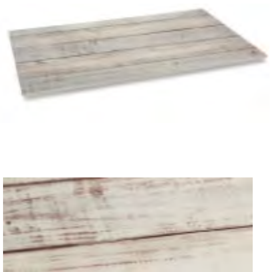
P22664 White wood serving tray Soporte presentación madera blanca Plateau présentation bois blanc

REF + color code / REF + código color / REF + code couleur