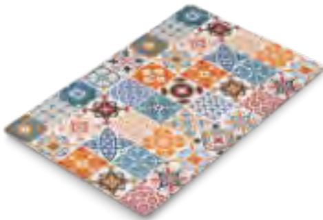
P22373 Display tray 1/1 Bandeja presentación 1/1 Plateau présentation 1/1