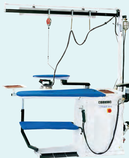
FRA-AVS CON LUZ