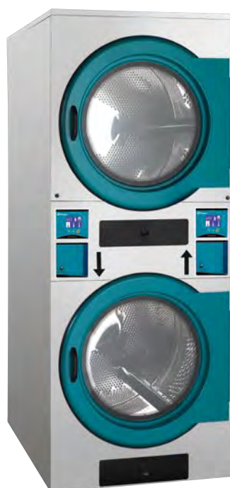
Central de pago

*Precisa kit fichero/monedero o kit central de pago.