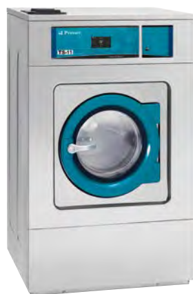
Central de pago