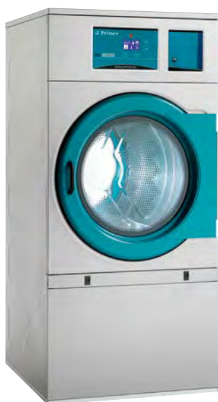
Central de pago