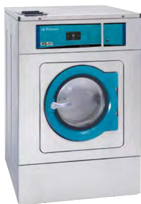
Central de pago