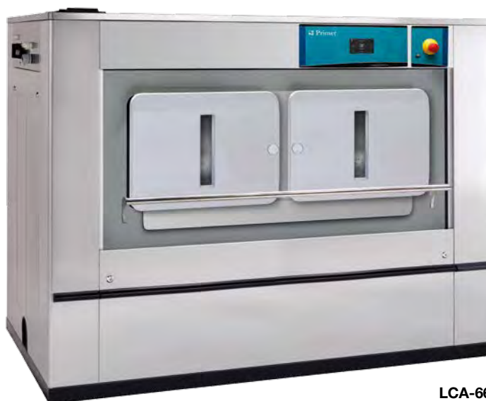
LCA-66 T vertical