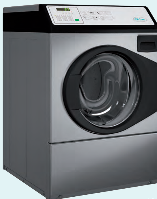
LC-10 P inox