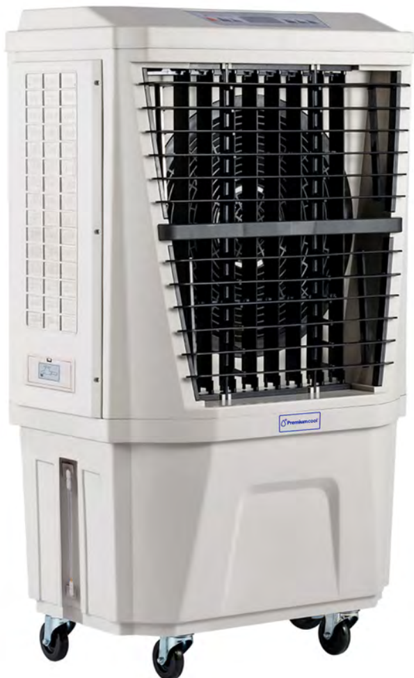
90° angle manual swing louver (vertical)