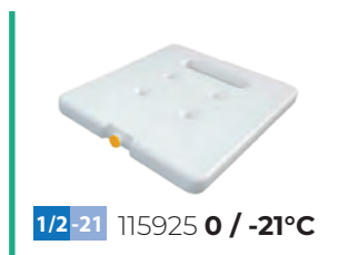
1/2-21 115925 0 / -21°C