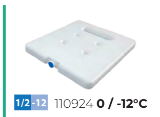
1/2-12 110924 0 / -12°C