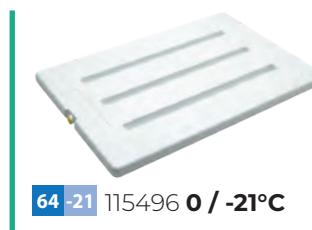
64-21 115496 0 / -21°C