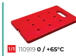
1/1 110919 0 / +65°C