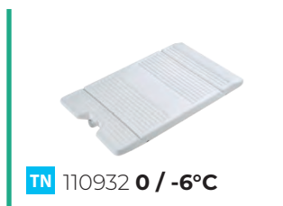
TN 110932 0 / -6°C

NO LIMPIE LA PLACA EUTECTICA EN EL LAVAVAJILLAS!