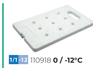
1/1-12 110918 0 / -12°C