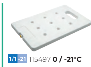
1/1-21 115497 0 / -21°C