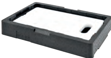
Con placa GN 1/1.