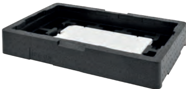
Con placa TN