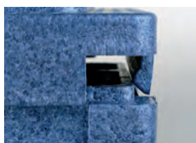
Cierre de encastre