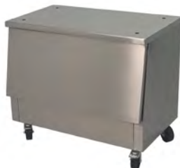
Mesa / Table Ref. 773.500 (Lux) Ref. 773.501 (Silver)